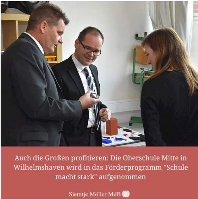
Beim Besuch vor der Pandemie haben Grant Hendrik Tonne und ich uns von der guten Arbeit an der Oberschule Stadtmitte überzeugt

Die aktuelle Situation macht uns allen klar, wie enorm wichtig Bildungsgerechtigkeit ist. Internationale Schulleistungsstudien wie PISA und TIMSS zeigen es immer wieder: Die Leistungen von sozial benachteiligten Schülerinnen und Schülern sind immer noch weniger gut als die anderen Schülerinnen und Schüler im gleichen Alter und die Lage wird durch die Pandemie und den fehlenden Präsenzunterricht nur verstärkt. Das Programm „Schule macht stark“ trägt zu mehr Bildungsgerechtigkeit bei und unterstützt Schulen in sozial schwierigen Lagen, die vor entsprechenden Herausforderungen stehen.