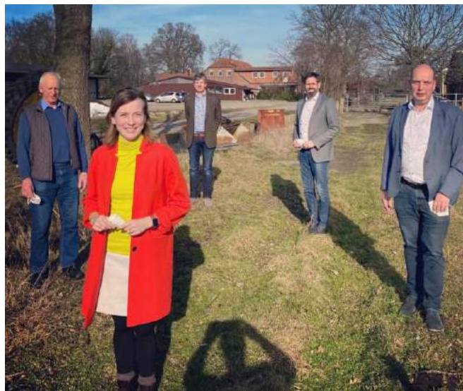
Im Gespräch mit Minister Olaf Lies und dem Landvolk: Wir wollen den Niedersächsischen Weg gemeinsam gehen!

mir zugesichert, dass man an Wegen arbeite, den Niedersächsischen Weg zu ermöglichen. Ich bin vorsichtig optimistisch, dass hier eine praktikable Lösung gefunden werden kann.